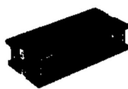
アシストツール (品番:ASS-V) (写真3)